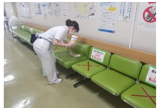
座席は隣り合わないようにして、定期的に消毒しています