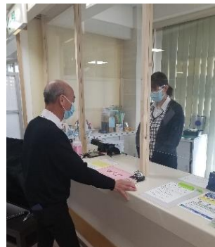
受付にアクリル板を設置しています。