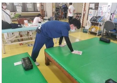
リハビリ実施ごとに消毒を行っています