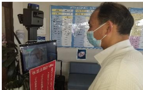
入口で自動測定カメラによる検温を行っています。